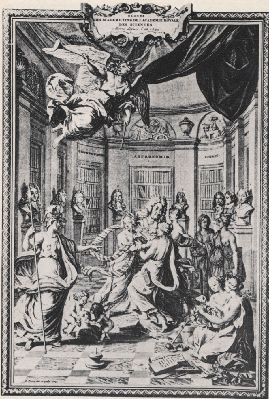
Fig. 3 Allegoria delle scienze in una tavola premessa agli «Eloges des Academiciens de l'Académie Royale des Sciences».

2) Un tipo costituito da « molte spiegazioni » che « non posseggono a prima vista una forma deduttiva, in quanto le loro premesse esplicative non implicano formalmente i loro explananda ».